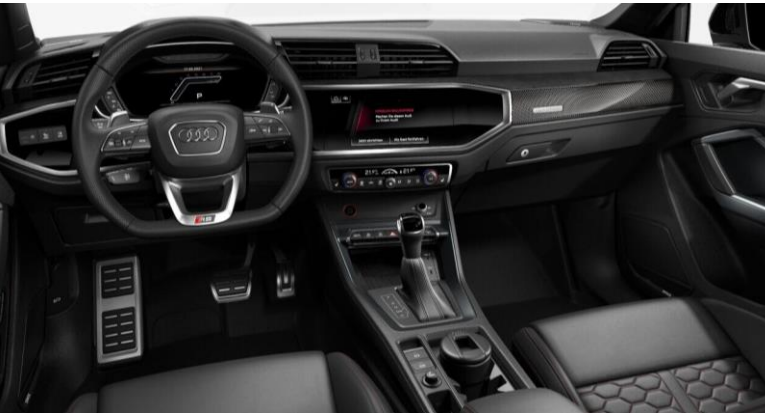
Detalles interiores en Alcántara negro y en Aluminio