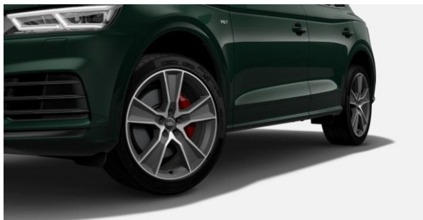
Llantas de aleación de aluminio 20". Pinzas de freno en Rojo.