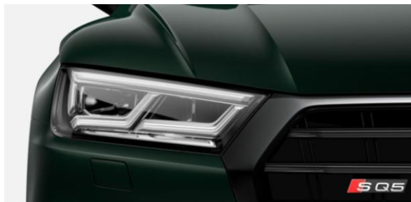
Luces LED con señalizadores posteriores dinámicos