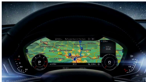
Audi Virtual Cockpit con sistema de navegación MMI® Plus