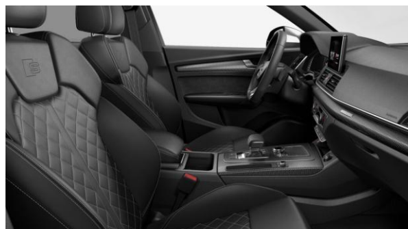
Asientos deportivos S en Cuero Nappa con acolchado de rombos.