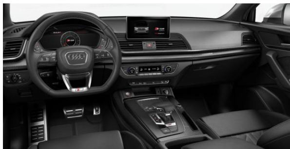
Volante achatado multifunción plus. Inserciones Carbono Atlas.