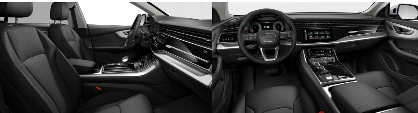
Fotos interior versiones Sport