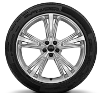
Llanta 21" disponible para versiones 45 TDI Sport y 55 TFSI Sport