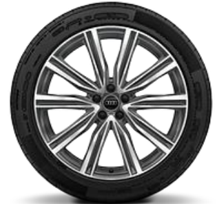
Llanta 21" disponible para versiones 45 TDI y 55 TFSI