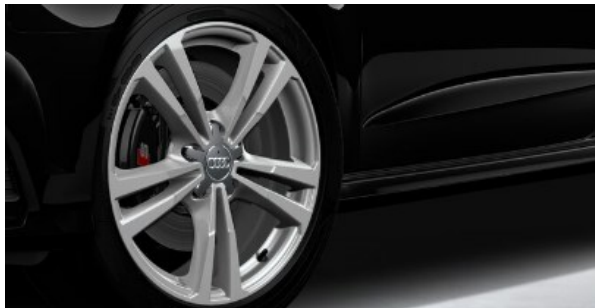
Llantas aleación ligera 7,5J x 18". Diseño de 5 radios paralelos, parcialmente pulidos.