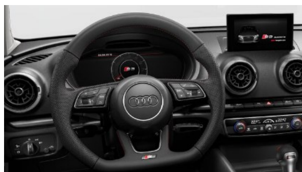
Volante deportivo de 3 radios multifuncional achatado en la parte inferior con levas para cambio S tronic.