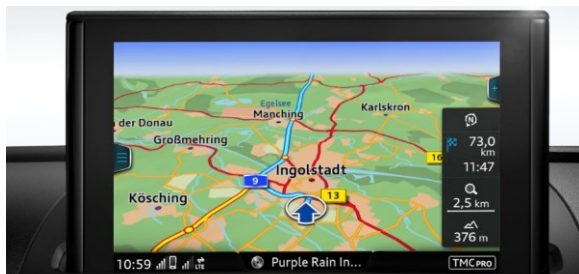
MMI touch con navegación plus.