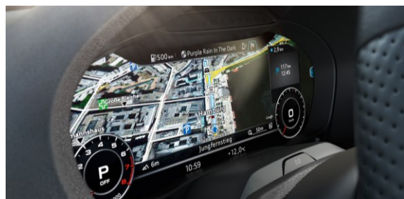
Audi virtual cockpit