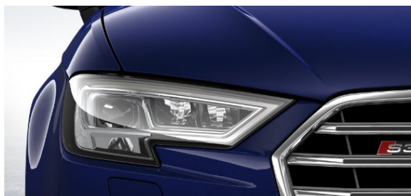
Faros LED con señalizadores posteriores dinámicos.