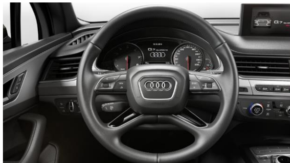
Volante multifunción en cuero, diseño 4 radios y levas de cambio