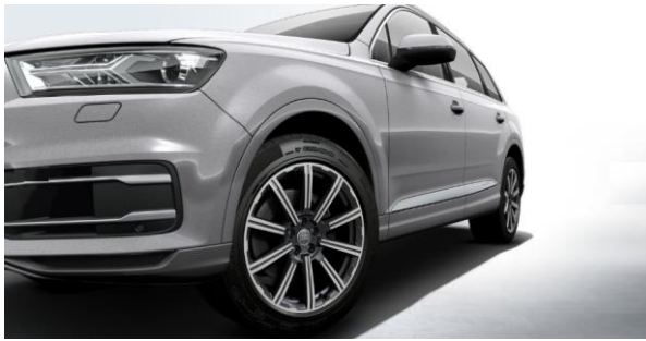
Llantas de aleación de aluminio tamaño 9Jx20, diseño estrella de 10 radios, con neumáticos 285/45