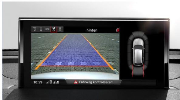
Sistema de aparcamiento plus delantero y trasero con cámara trasera