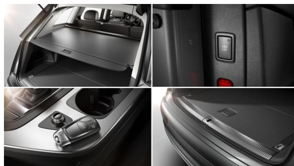
Llave de confort con desbloqueo del maletero por control gestual