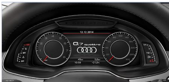
Audi Virtual Cockpit

*Datos entregados por el 3CV. El rendimiento efectivamente obtenido por cada conductor dependerá de sus hábitos de conducción, de la frecuencia de mantenimiento del vehículo, de las condiciones ambientales y geográficas, entre otras.