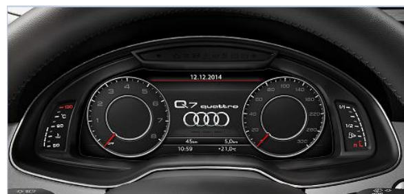
Audi Virtual Cockpit con MMI Navigation plus y panel touch