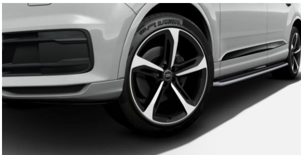
Llantas Audi Sport de aluminio 21", diseño Blade de 5 radios con neumáticos 285/40