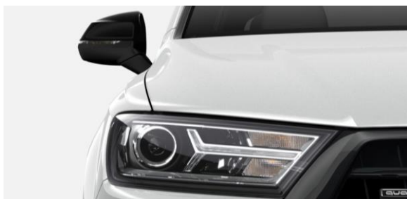
Luces de Xenón Plus – Espejos Laterales en Negro