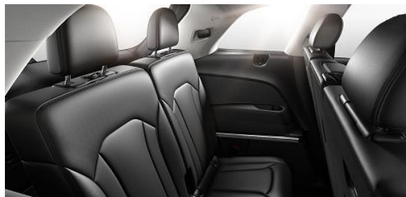
Tercera corrida de asientos eléctricos

*Datos entregados por el 3CV. El rendimiento efectivamente obtenido por cada conductor dependerá de sus hábitos de conducción, de la frecuencia de mantenimiento del vehículo, de las condiciones ambientales y geográficas, entre otras.