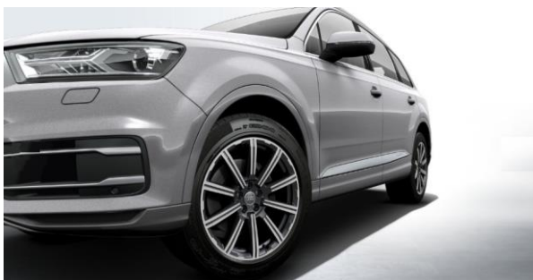
Llantas de aleación de aluminio tamaño 9Jx20, diseño estrella de 10 radios, con neumáticos 285/45