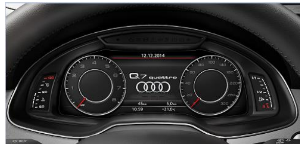
Audi Virtual Cockpit con MMI Navigation plus y panel touch