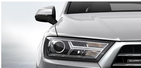
Luces de Xenón incl. luz LED de circulación diurna