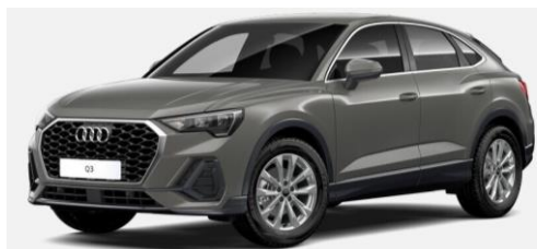
Exterior Versión 35 TFSI