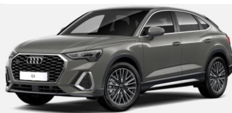
Exterior Versiones Sport