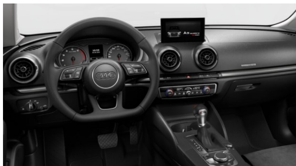
Volante achatado deportivo con shift paddles.