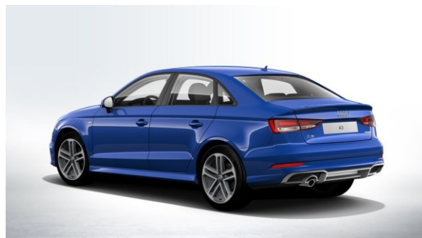
Paquete deportivo Sline Exterior