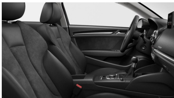
Tapizado de asientos en Cuero Alcántara