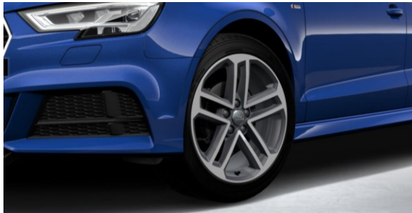
Llantas de aleación ligera 8J x 18. Diseño de 5 radios dobles. Neumáticos 225/40 R 18