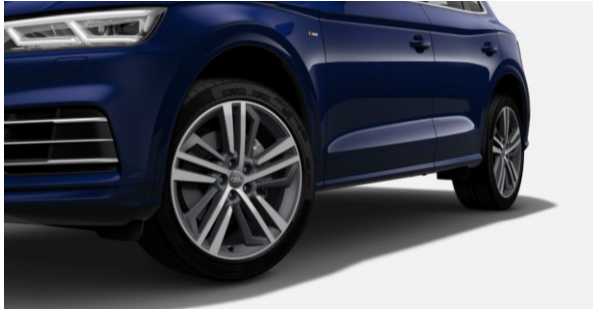
Llantas de aleación de aluminio tamaño 8Jx20