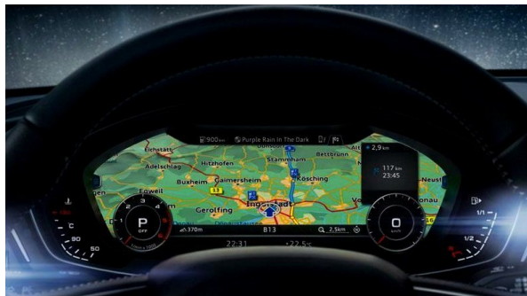
Sistema de navegación Plus y Virtual Cockpit