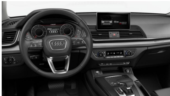
Volante multifunción en cuero, diseño 3 radios