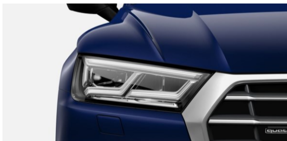
Luces LED con señalizadores posteriores dinámicos