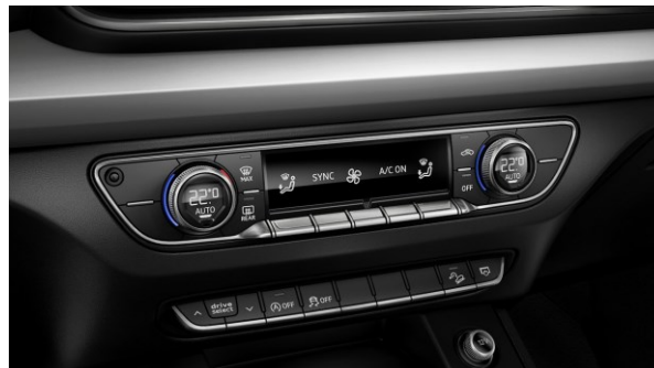
Climatizador 3 zonas