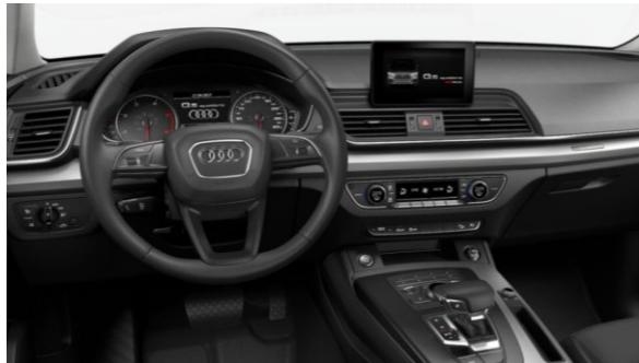
Volante multifunción en cuero, diseño 3 radios