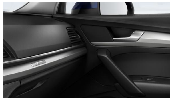
Inserciones interiores en Aluminio