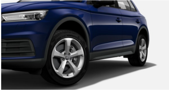
Llanta 18" diseño de 5 brazos 8 J x 18, (235/60 )