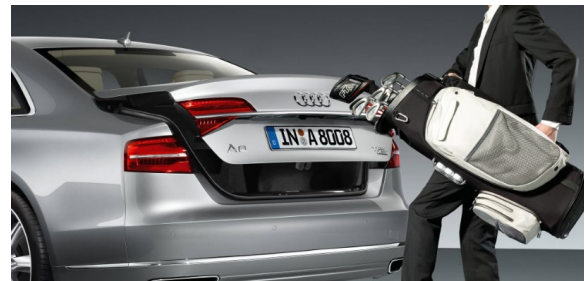
Comfort key con desbloqueo del maletero por control gestual